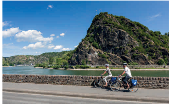
Auf dem Rheinradweg vorbei an der Loreley

Wein, Kultur und eine atemberaubende Landschaft: Der Rhein zeigt sich zwischen dem Mäuseturm in Bingen und dem Rolandsbogen bei Remagen von seiner romantischsten Seite – und das hat nicht nur mit dem Singen der Loreley zu tun. Wo die Schiffer einst schwärmend in den Fluten versanken, gibt es heute viele gute Gründe, dem Charme einer Region mit außergewöhnlichen Reizen zu erliegen. Historie und moderne Lebensart verbinden sich an mehr als 100 Stromkilometern auf Schritt und Tritt. Burgen, Schlösser und idyllische Städte bilden dabei eine lebendige Kulisse für Musik und Theater, bei Konzerten des Mittelrhein-Musik-Festivals oder Events im Rahmen des Kultursommers Rheinland-Pfalz. Winzer und Wirte bieten nicht nur bei Weinfesten kulinarische Highlights. Tausende bestaunen die „Rhein in Flammen“-Feuerwerke zwischen Remagen und Bingen. An den Raderlebnistagen „Tal total“, „Jedem Sayn Tal“ und „WIEDER ins Tal“ präsentiert sich die Region sogar autofrei.