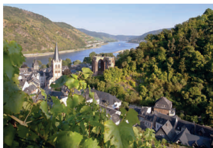
Blick auf Bacharach