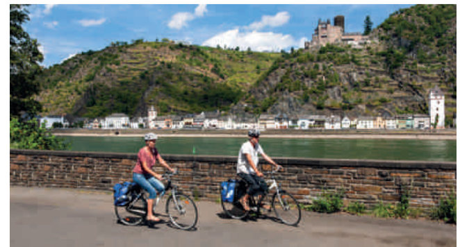
Auf dem Rheinradweg vorbei an der Burg Katz

Bitte beachten Sie: Bei den vorgenannten Liniennummern werden bereits die ab dem Fahrplanwechsel zum 11. Dezember 2016 neu geltenden Nummern verwendet.