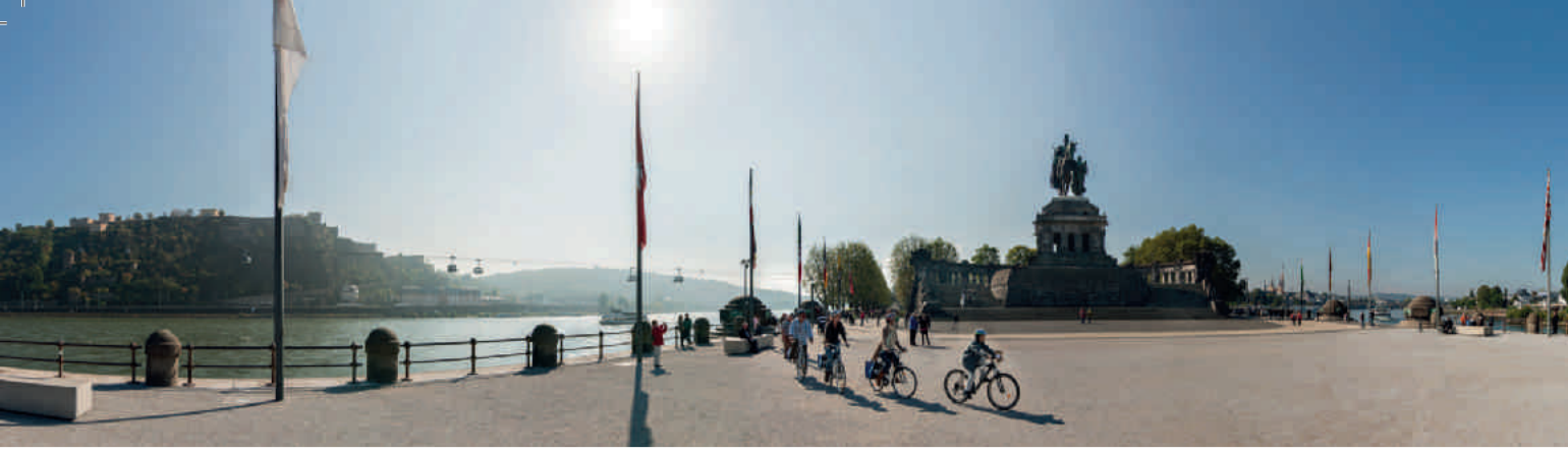
Panoramablick am Deutschen Eck