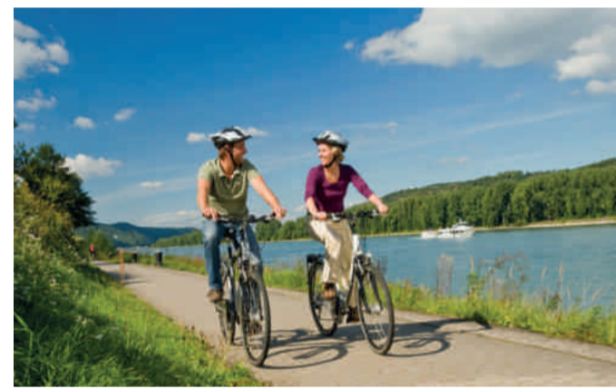
Auf dem Rheinradweg bei Brey

Die Fahrradmitnahme auf den Bahnstrecken ist in Rheinland-Pfalz und im Saarland montags bis freitags ab 9 Uhr sowie samstags, sonn- und feiertags den ganzen Tag kostenlos . Vor 9 Uhr müssen Sie montags bis freitags eine Nahverkehrs-Fahrradkarte lösen. Wenn Sie Ihre Radtour mit einer Zugverbindung im Rheinland-Pfalz-Takt planen, sollten Sie sich auf die Regionalbahnen (RB) konzentrieren. Die sind zwar etwas länger unterwegs, weil sie an allen Stationen halten. Dafür haben sie aber in der Regel das größte Platzangebot. Im RegionalExpress (RE) ist dagegen nur Platz für wenige Fahrräder pro Wagen. In Fernverkehrszügen können Sie Ihr Rad ebenfalls mitnehmen, müssen aber auf jeden Fall kostenpflichtig einen Stellplatz reservieren.