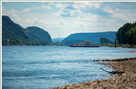
Fähre zwischen Bad Breisig und Bad Hönningen

Auf den meisten Ausflugsschiffen können Sie Ihr Rad mitnehmen. Zahlreiche Fähren ermöglichen einen schnellen Wechsel der Rheinseiten. Weitere Informationen unter www.romantischer-rhein.de/nostalgische-rheinschiffahrt