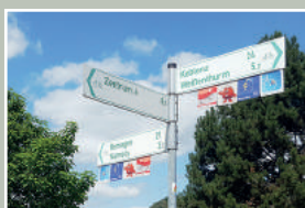
Radwegweiser mit Routenlogo

Die Radwegweiser sind anhand der grünen Schrift auf weißem Grund farblich gut zu erkennen. Die Wegweiser zeigen Fahrtziel, Entfernungsangabe, Fahrradpiktogramm und Pfeil. Der Rheinradweg wird zusätzlich mit eigenem Logo gekennzeichnet, das an den Schildern als Zusatzplakette angebracht ist. Einfach den Routenlogos folgen und bequem ans Ziel kommen.